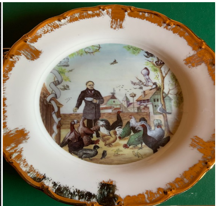
Porzellan -Teller Robert Oettel